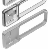
Kunststoff matt chrom